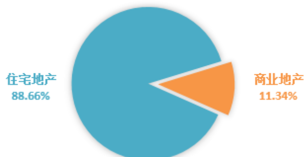
房地产开发业务分产品

报告期内，公司房地产开发业务分部实现营业收入52.71亿元，同比增长39.92%；实现净利润5.1亿元，同比增长62.38%。